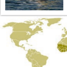
Spot-billed Pelican P. philippensis پلیکان فیلیپینی