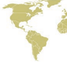
Great white Pelican P. onocrotalus پلیکان سفید