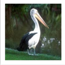
Australian Pelican P. conspicillatus پلیکان استرالیایی